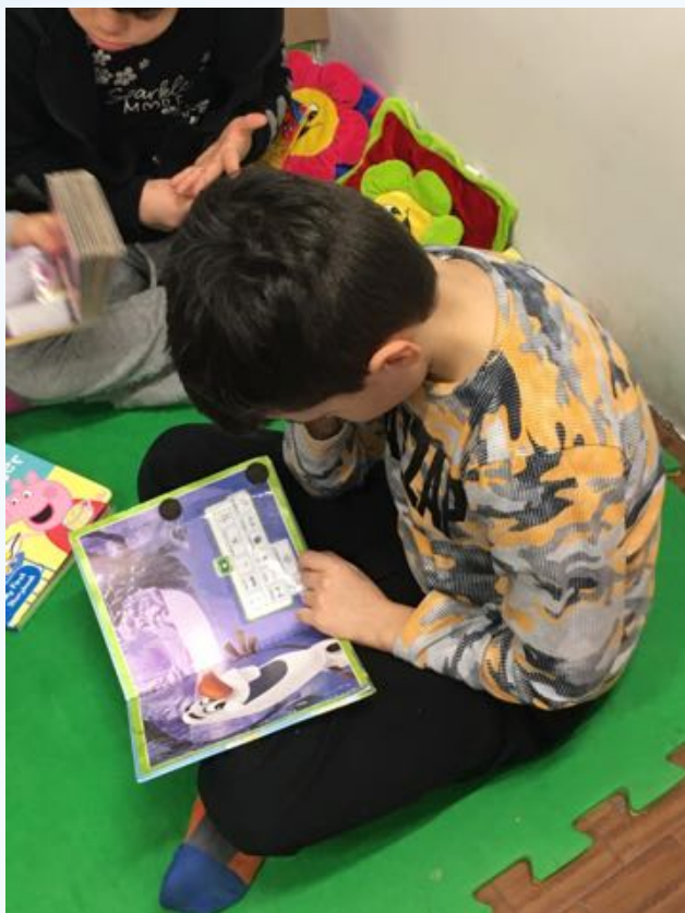
TABELLA A TEMA: leggere insieme